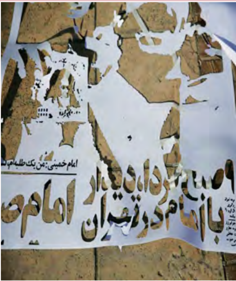
امد فرهنگ کارشناس ارشد ادبیات فارسی دانشگاه تربیت مدرس

مطالعه‌ی غیر درسی را به صورت خودجوش با مجله‌ی کیهان بچه‌ها و در همین پایه‌ی تحصیلی آغاز کردم. در پایه‌ی هفتم که وارد سیکل اول دبیرستان شدم، مجله‌ی دختران و پسران و نشریات دیگر نیز اضافه شد و علاوه بر آن عضو کتابخانه بزرگ شهر هم شدم. عادت به سینما رفتن نیز پیدا شد. تا پیروزی انقلاب ششصد فیلم سینمایی دیدم. از سیکل دوم دبیرستان به عضویت گروه تئاتر آزاده فرهنگ و هنر درآمدم و پنج سال خاک صحنه خوردم. در خرداد۱۳۵۶ دیپلم گرفتم.