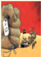
از انقلاب تا ظهور