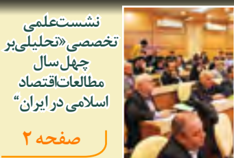
نشست علمی تخصصی «تحلیلی بر چهل سال مطالعات اقتصاد اسلامی در ایران»