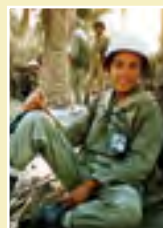
همه‌ی سربازان خمینی