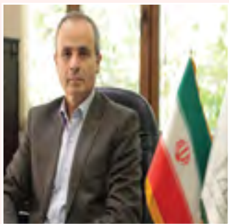
چهل سالگی انقلاب اسلامی؛ افتخار به گذشته، امید به آینده

انقلاب ما انفجار نور بود. حضرت امام خمینی (ره) ایام مبارک و غرورآفرین دهه فجر پیروزی انقلاب اسلامی یادآور راهبری‌های انقلابی و حیات‌بخش رهبر کبیر و فقید انقلاب اسلامی و فداکاری‌های عظیم ملت بزرگ ایران است؛ ملتی که پس از انقلاب اسلامی در عرصه‌های مختلف اجتماعی، سیاسی و فرهنگی به موفقیت‌های بزرگ دست یافت و نام ایران را در حوزه‌های مختلف