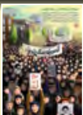
به افتخار زنان میهنم